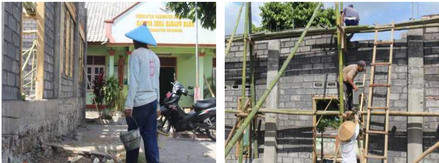
Kegiatan Pembangunan Gedung Serba Guna 50 %