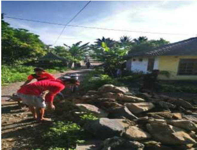
Pekerjaan Talud Jalan 100%