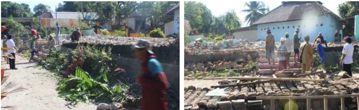
Kegiatan Pembangunan Gedung Serba Guna 20 %