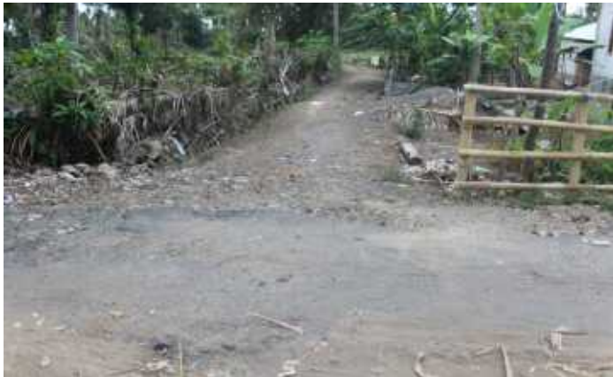
PekerjaanTalud Jalan 0 %