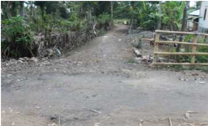
Pekerjaan Talud Jalan 50%