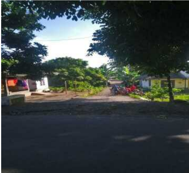
Pekerjaan Talud Jalan 50%