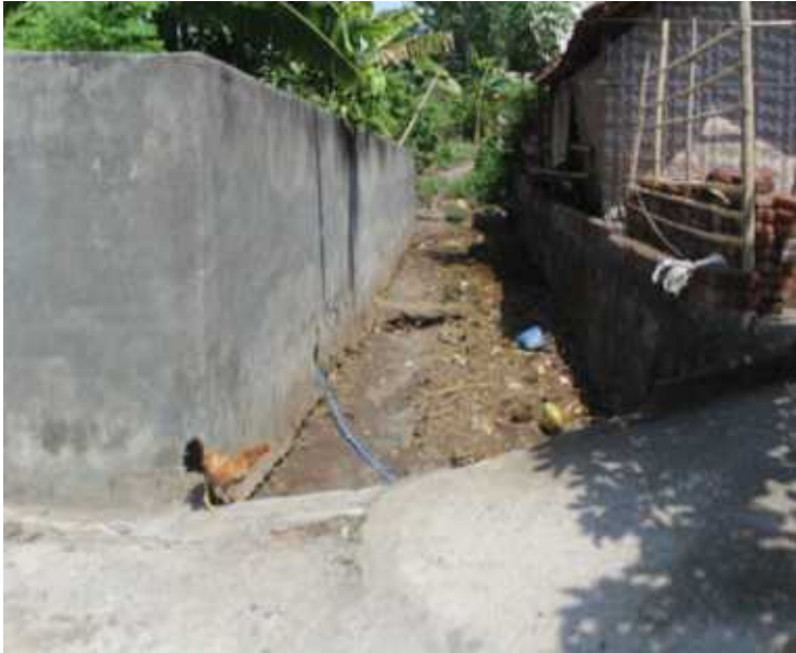
Pekerjaan Talud Jalan 0%