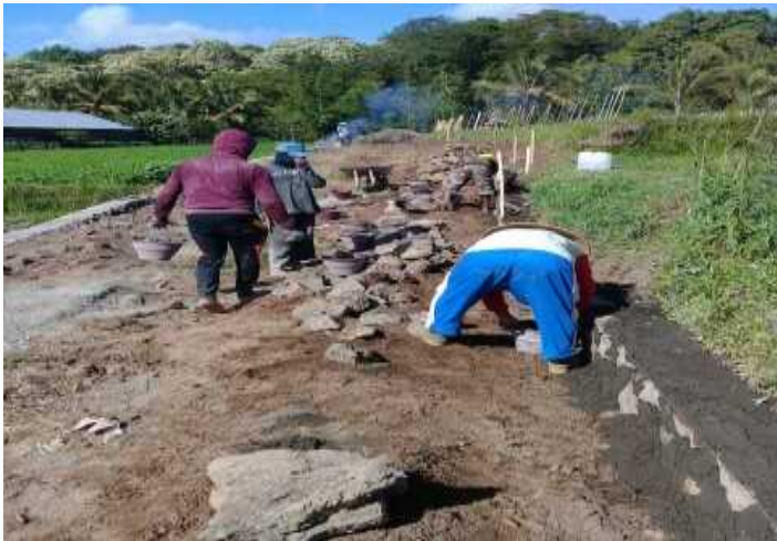
Pekerjaan Talud Jalan 100%